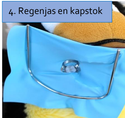
4. Regenjas en kapstok