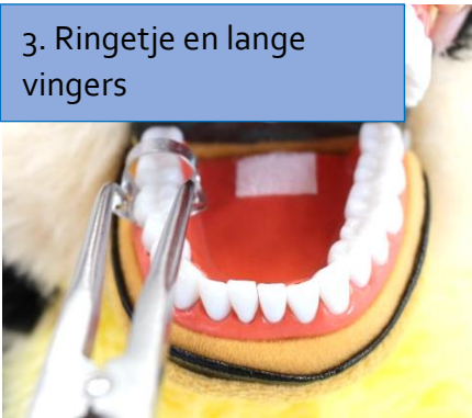
3. Ringetje en lange vingers